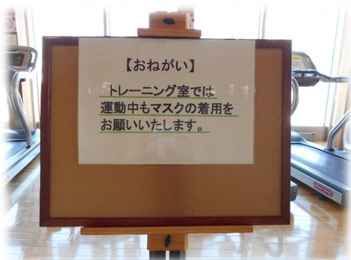
運動中もマスクの着用を依頼