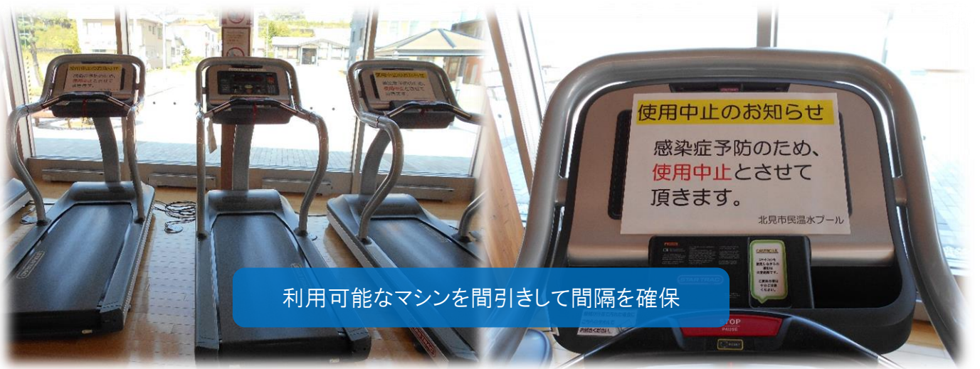
利用可能なマシンを間引きして間隔を確保