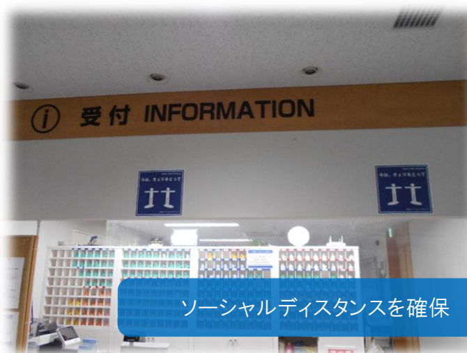
ソーシャルディスタンスを確保