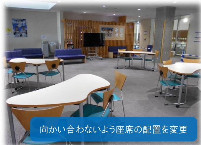
向かい合わないよう座席の配置を変更