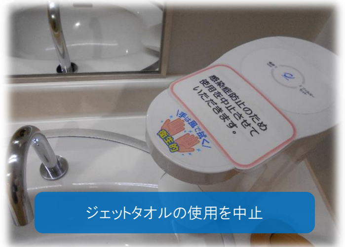
ジェットタオルの使用を中止