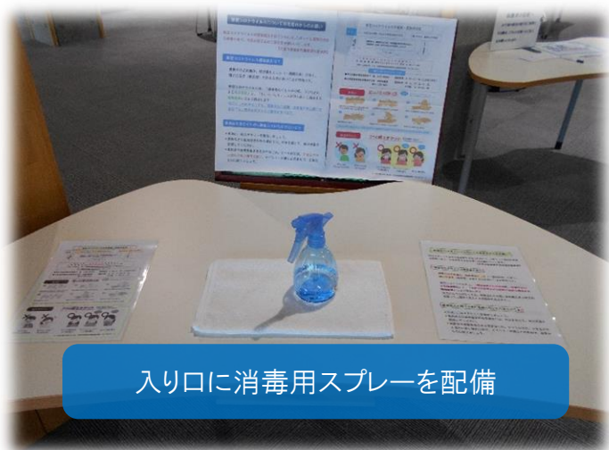
入り口に消毒用スプレーを配備