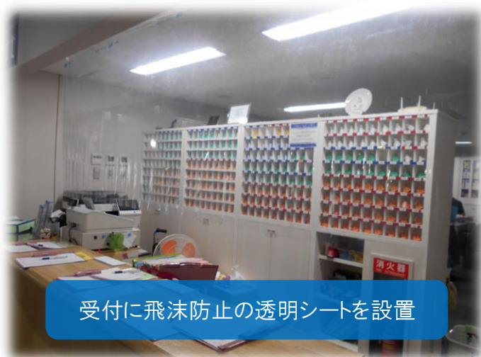
受付に飛沫防止の透明シートを設置